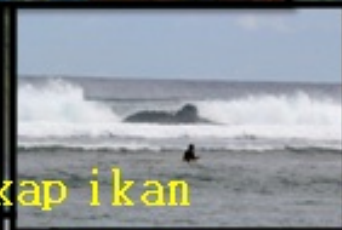
Pemasangan tali perangkap ikan