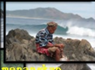
Menunggu waktu yang tepat untuk menangkap